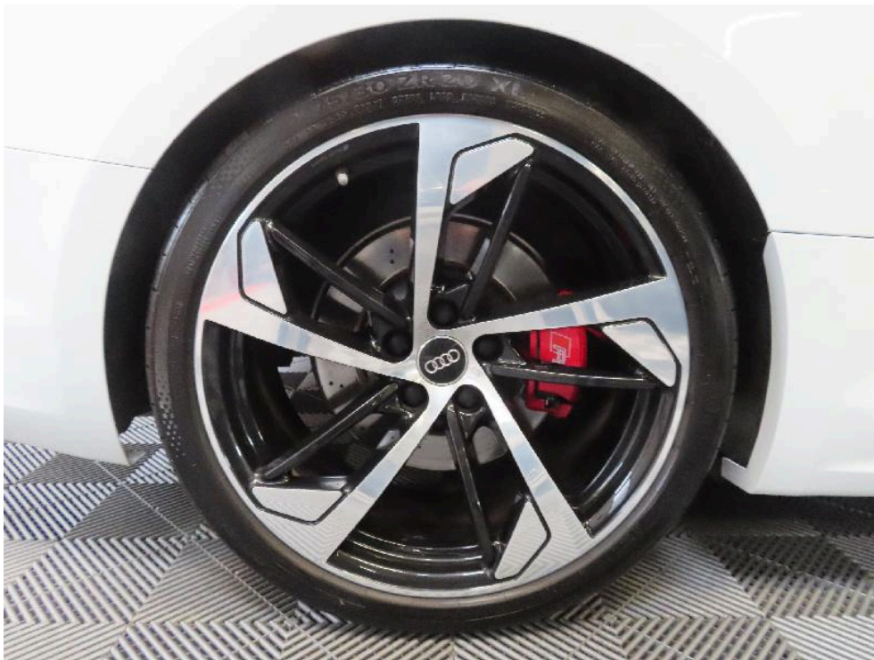
Bild: 13 Reifen / Felge hinten rechts