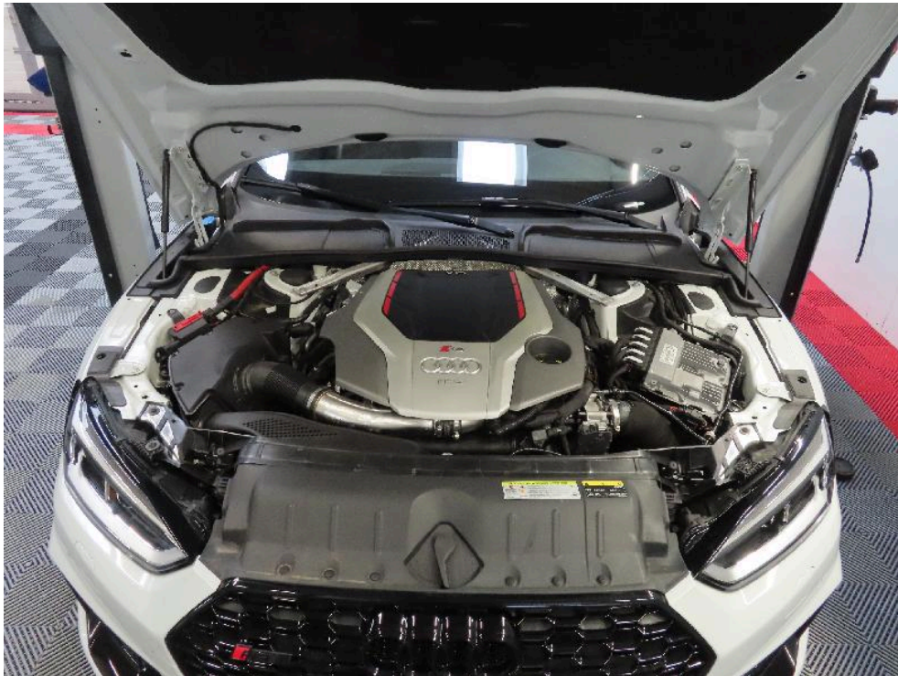
Bild: 7 Motorraum