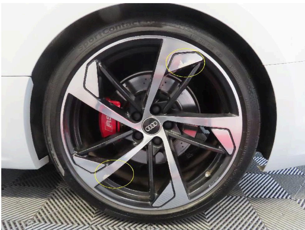
Bild: 14 Reifen / Felge hinten links