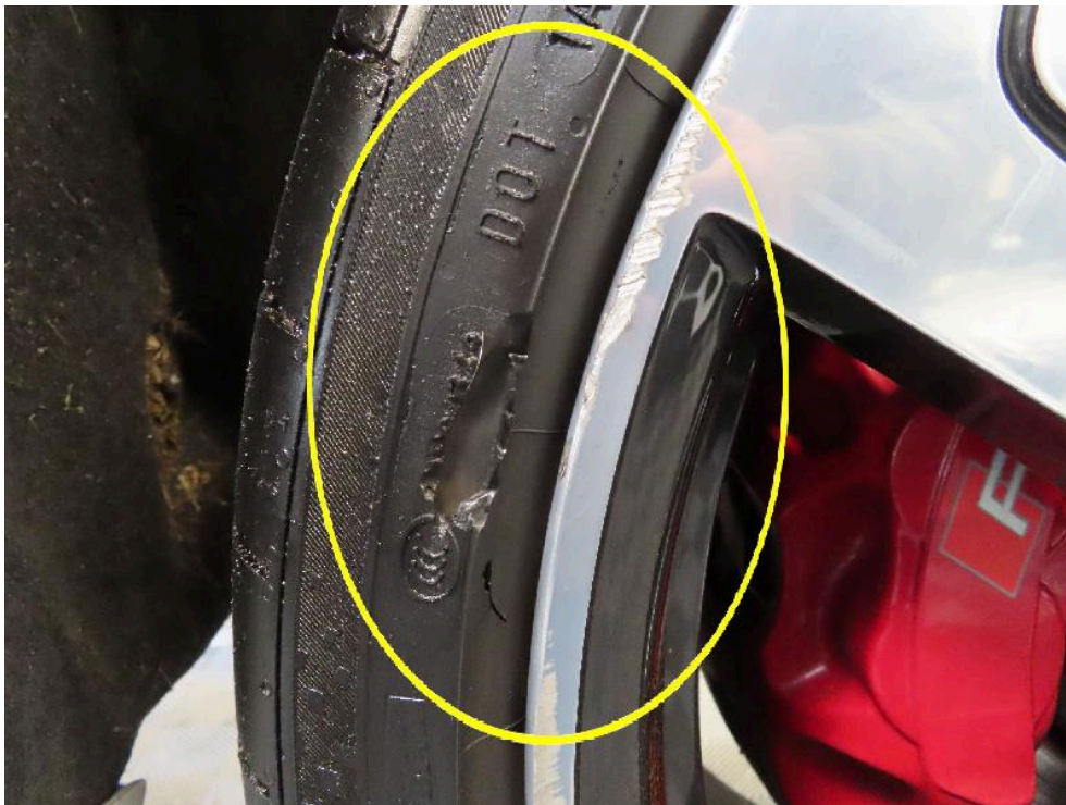
Bild: 15 Beschädigung Reifen/ Felge vorn rechts