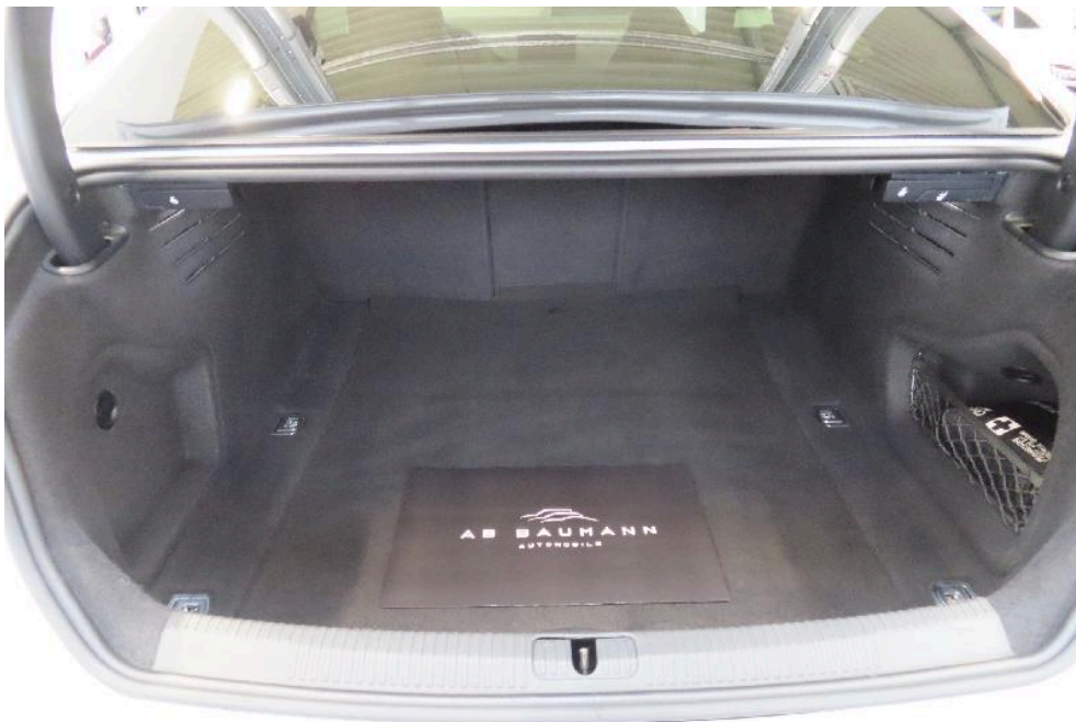
Bild: 10 Kofferraum