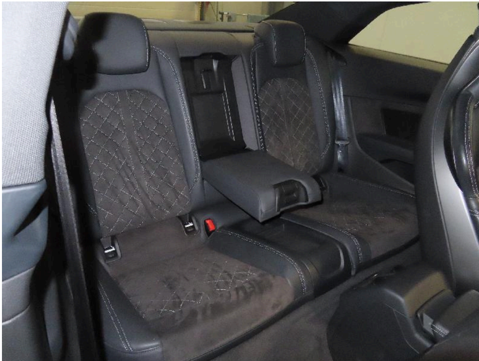
Bild: 9 Innenraum, hinten rechts