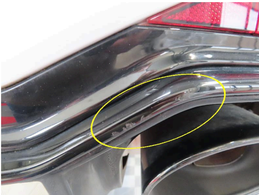
Bild: 16 Kratzer Stoßstange hinten rechts