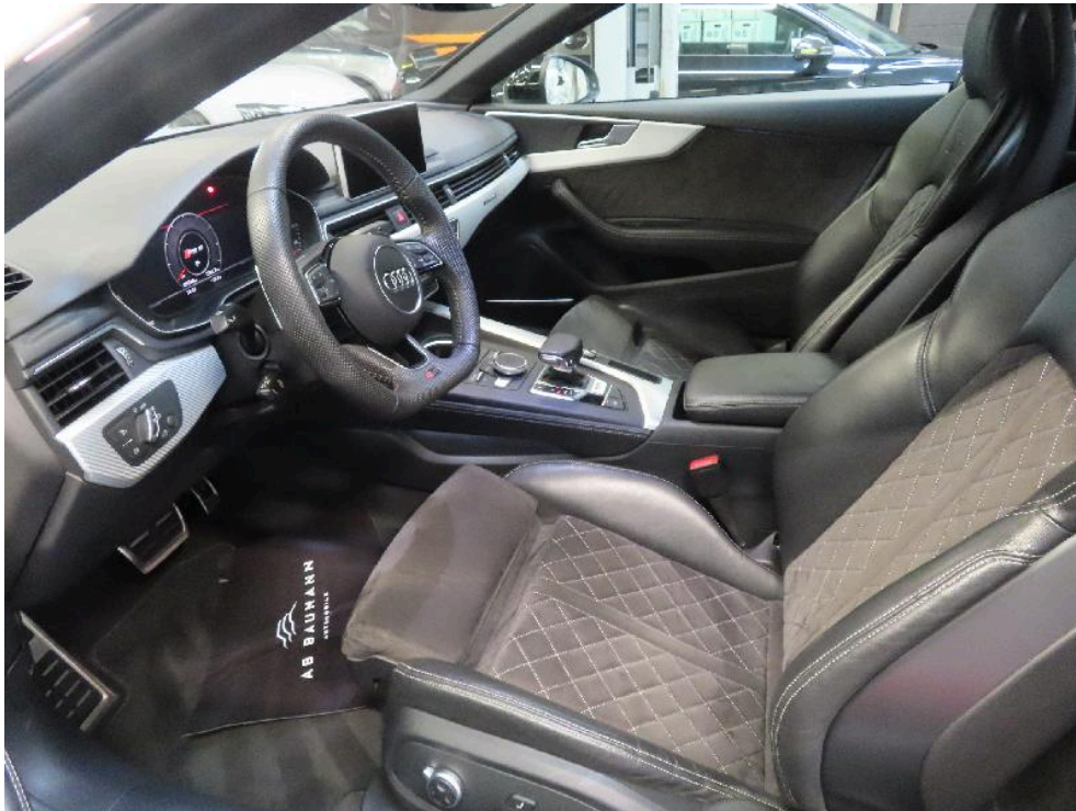
Bild: 5 Innenraum, vorn links