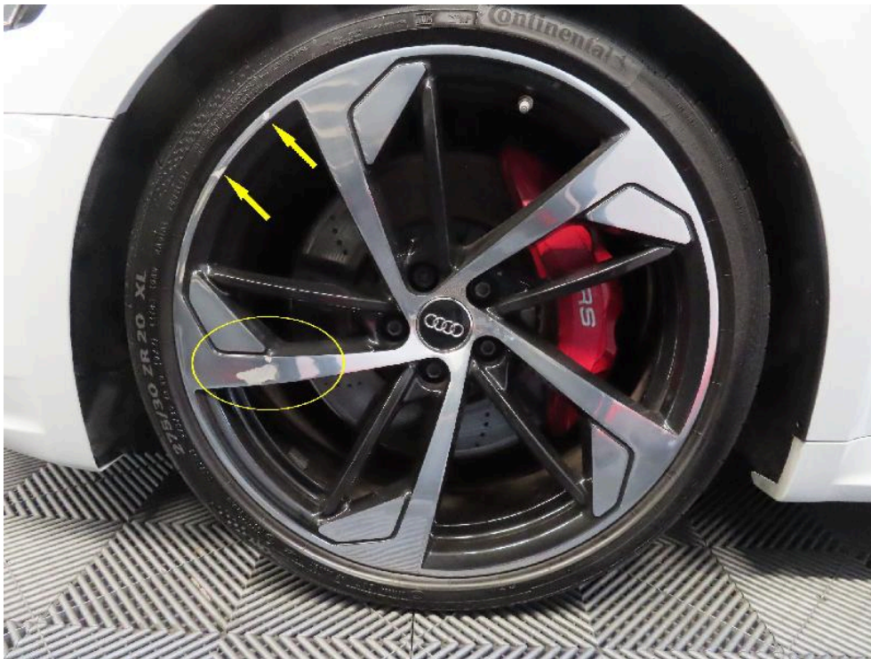
Bild: 11 Reifen / Felge vorn links