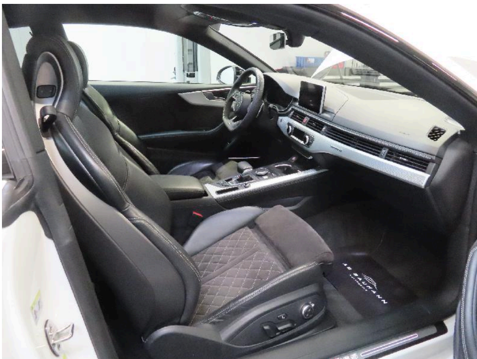
Bild: 8 Innenraum, vorn rechts