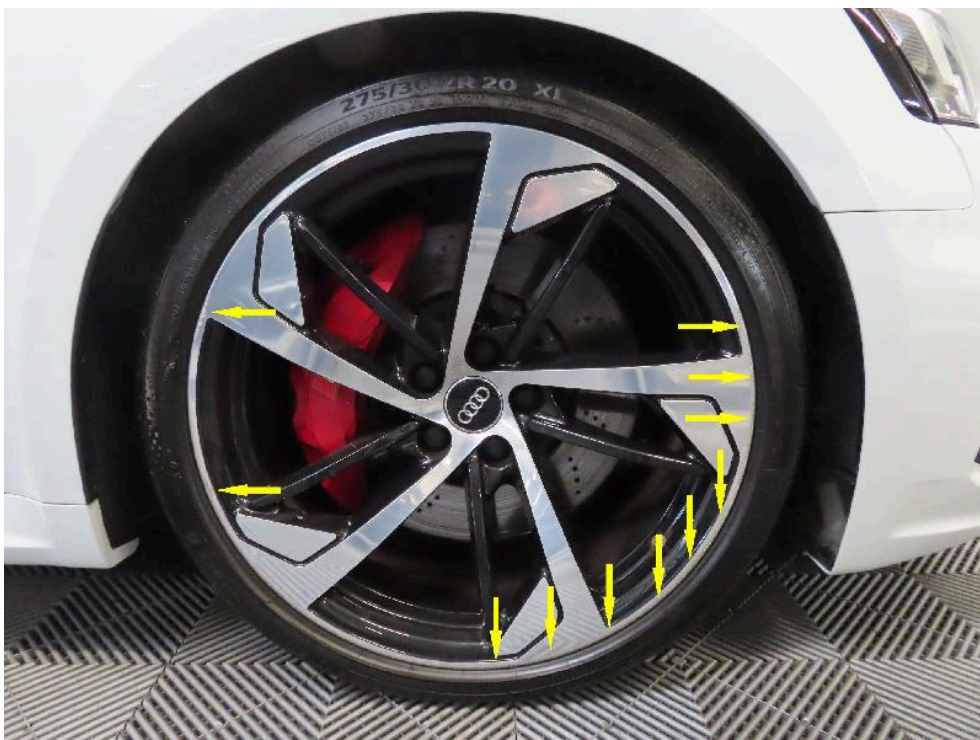
Bild: 12 Reifen / Felge vorn rechts