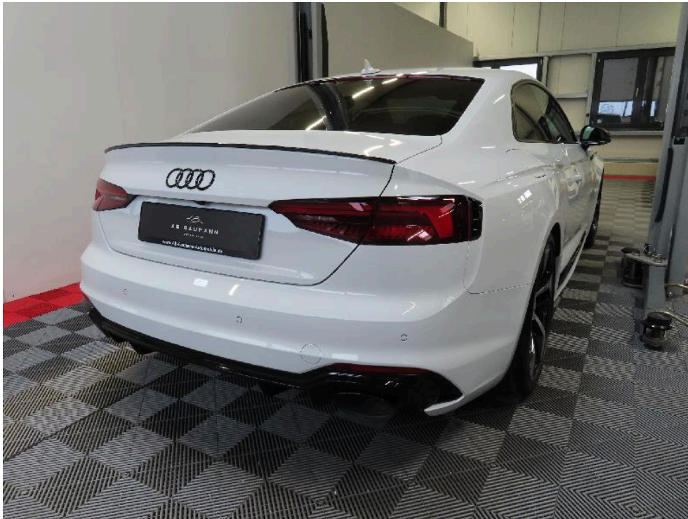
Bild: 3 Gesamtansicht hinten rechts