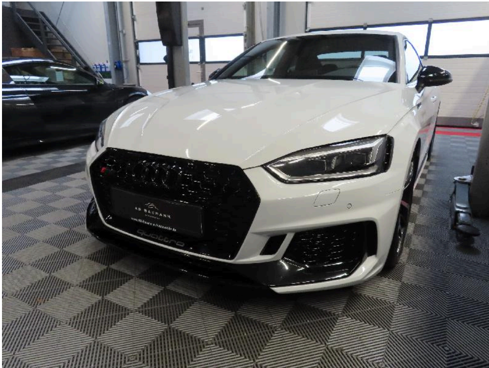
Bild: 1 Gesamtansicht vorn links