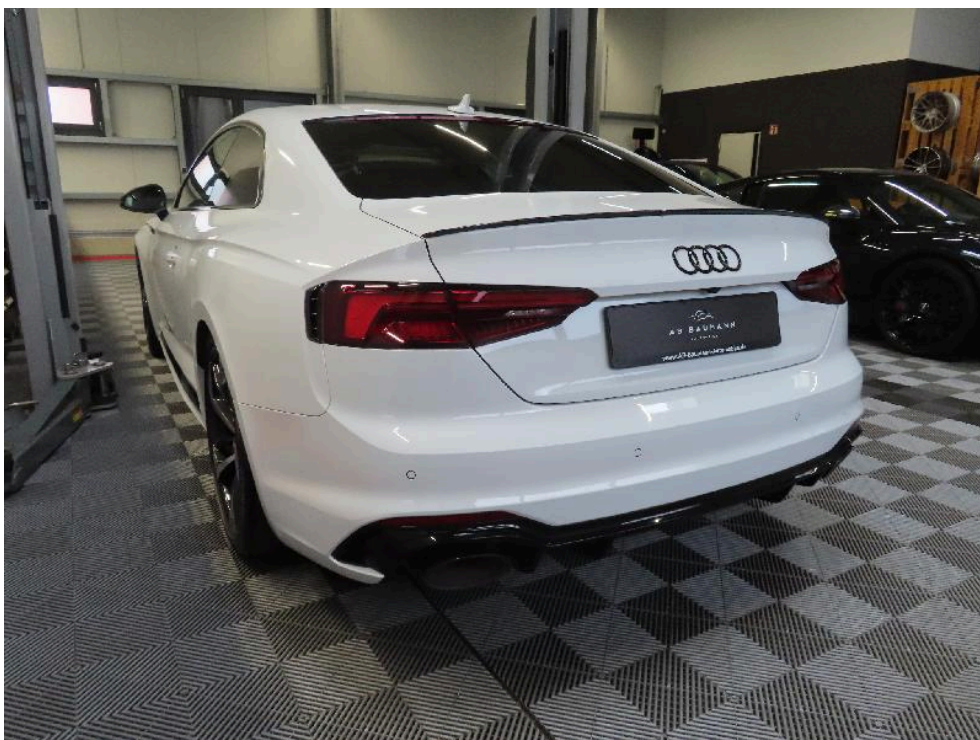
Bild: 4 Gesamtansicht hinten links