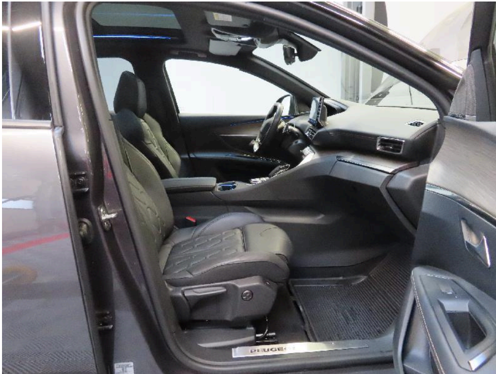
Bild: 7 Innenraum, vorn rechts