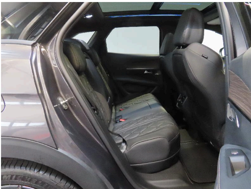
Bild: 8 Innenraum, hinten rechts