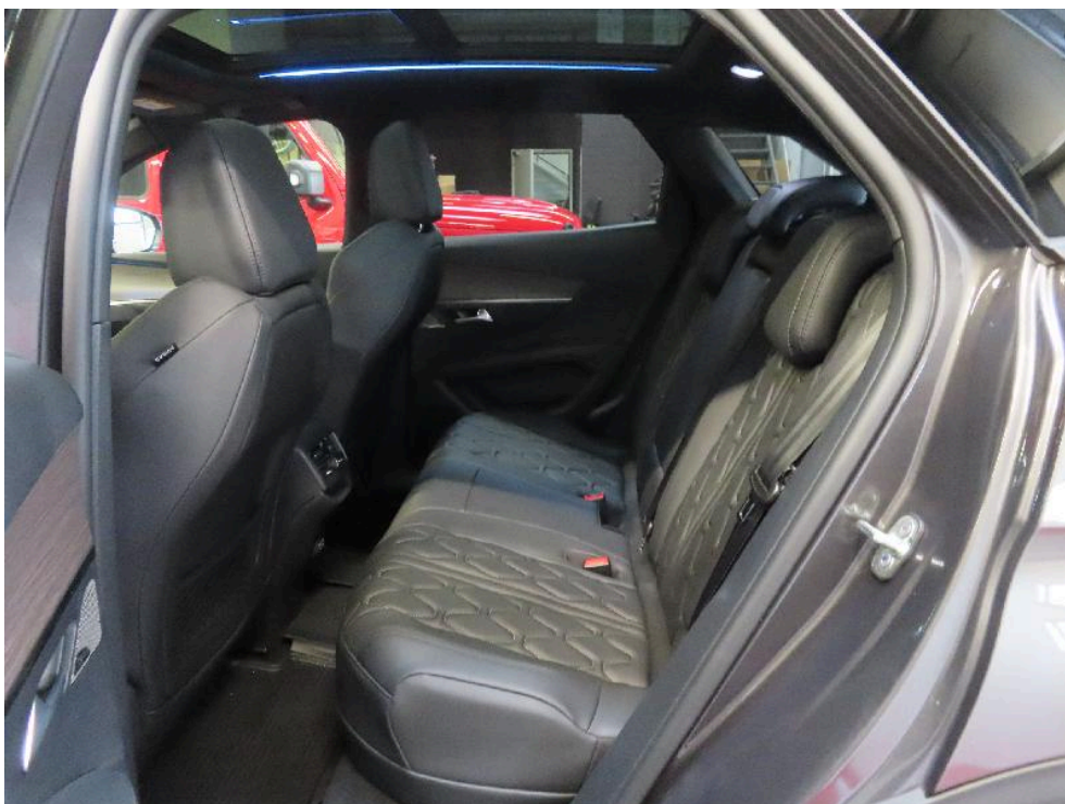
Bild: 10 Innenraum, hinten links