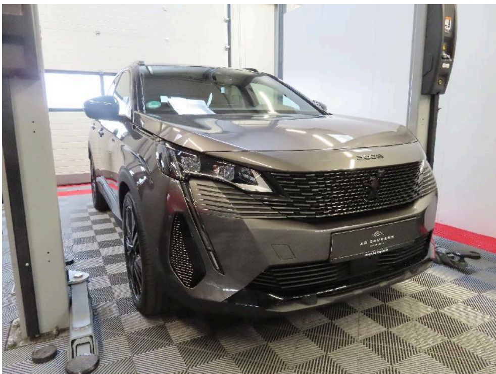
Bild: 2 Gesamtansicht vorn rechts