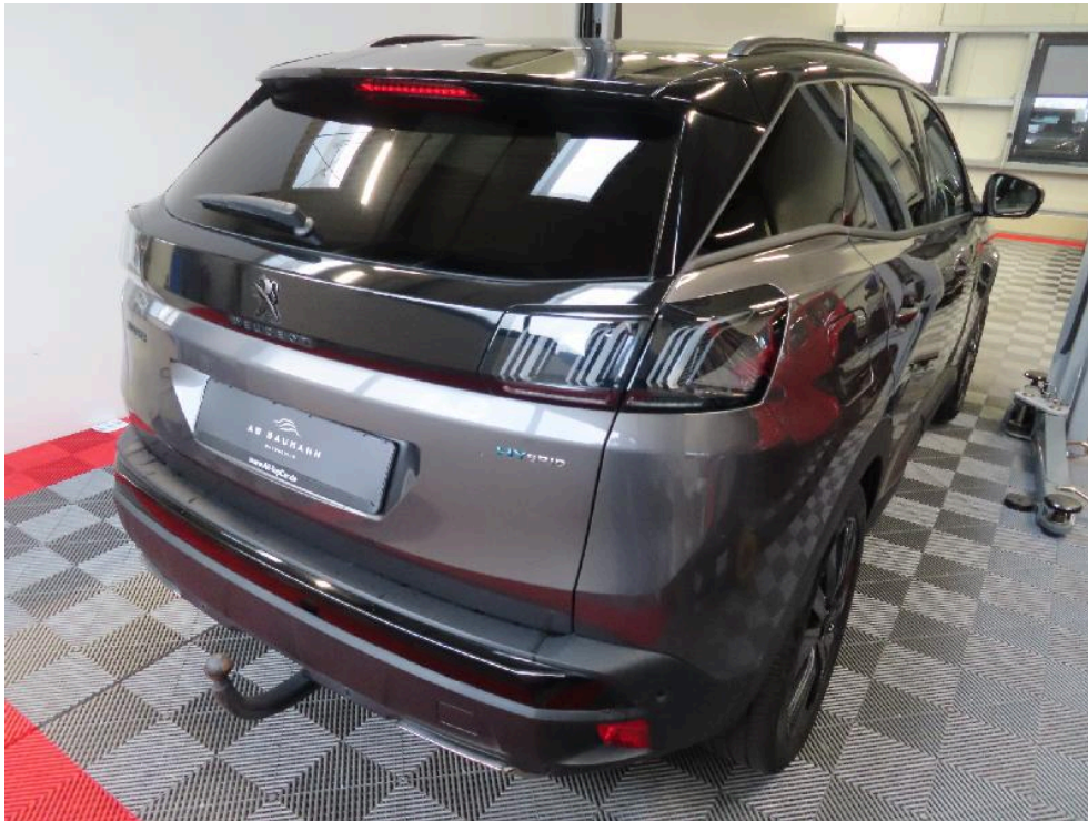
Bild: 3 Gesamtansicht hinten rechts