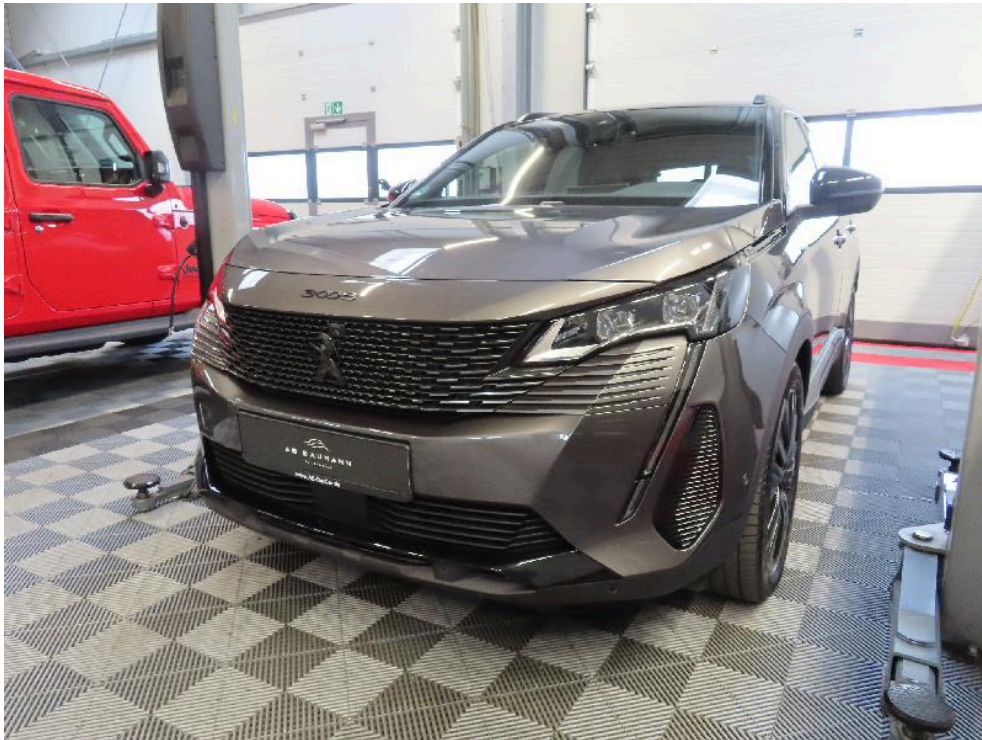
Bild: 1 Gesamtansicht vorn links