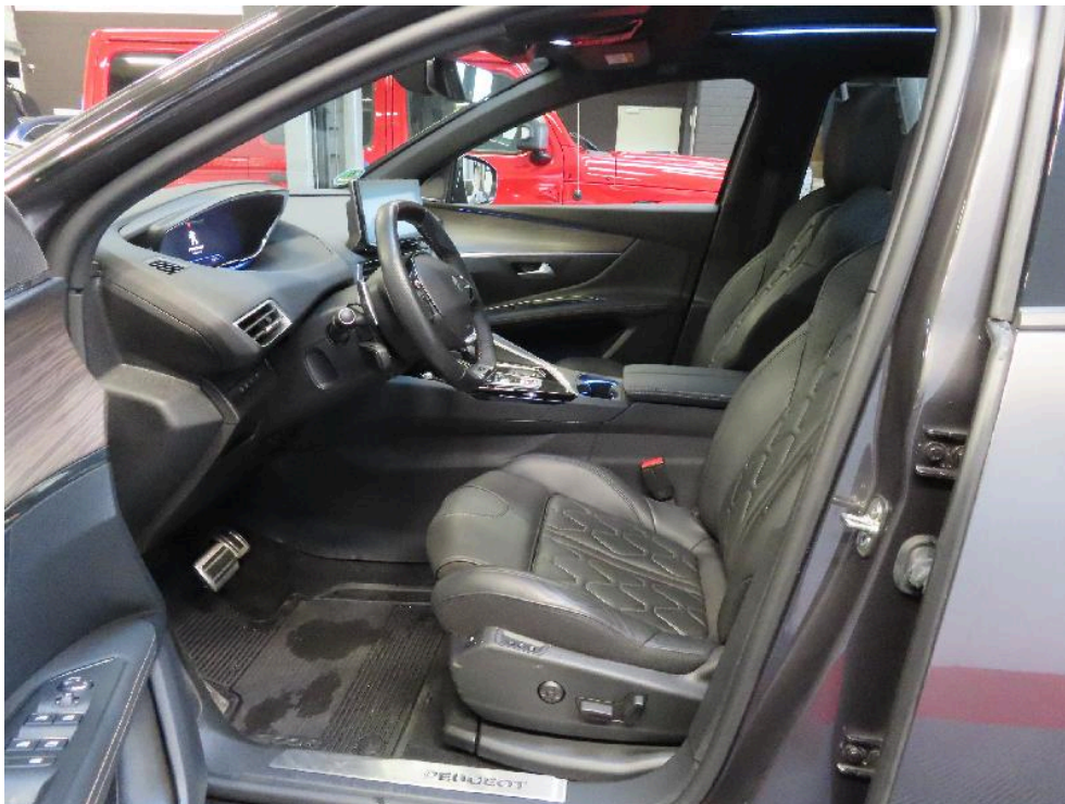
Bild: 5 Innenraum, vorn links