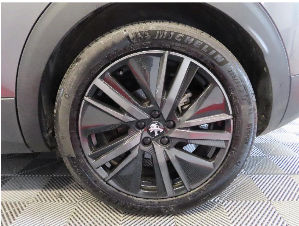
Bild: 14 Reifen / Felge hinten links