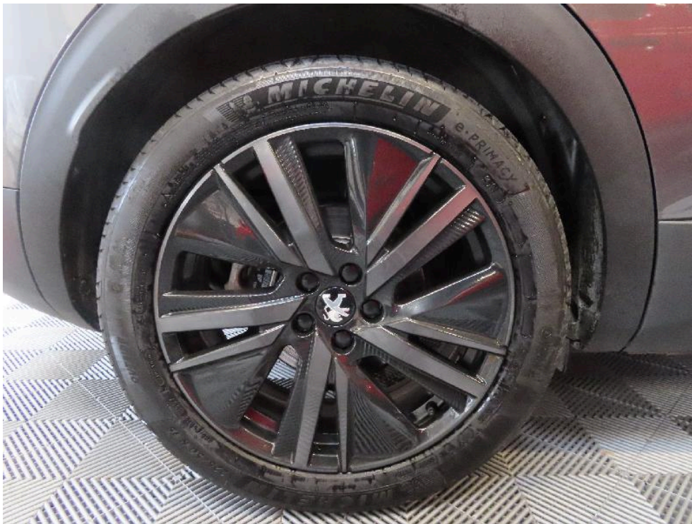
Bild: 13 Reifen / Felge hinten rechts