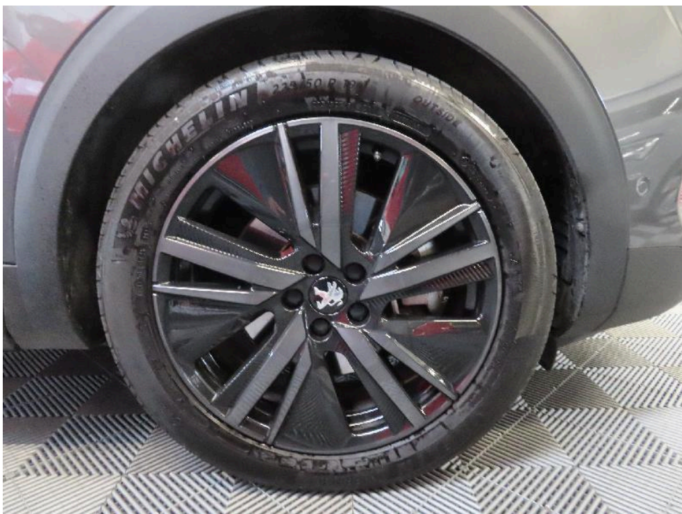
Bild: 12 Reifen / Felge vorn rechts