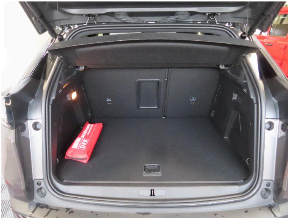
Bild: 9 Kofferraum