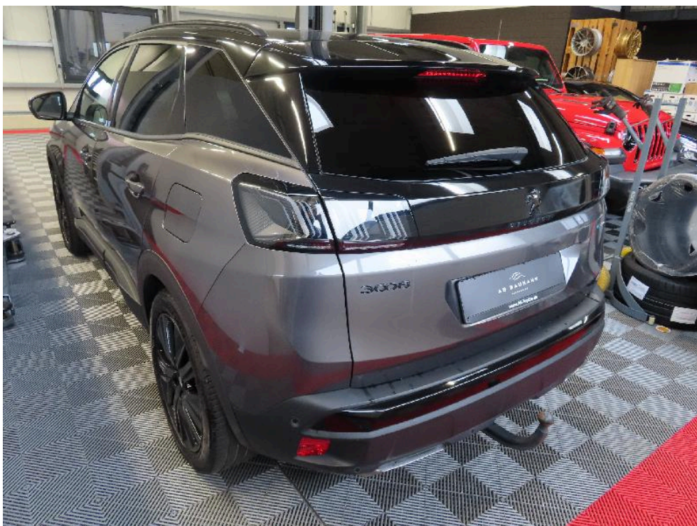
Bild: 4 Gesamtansicht hinten links