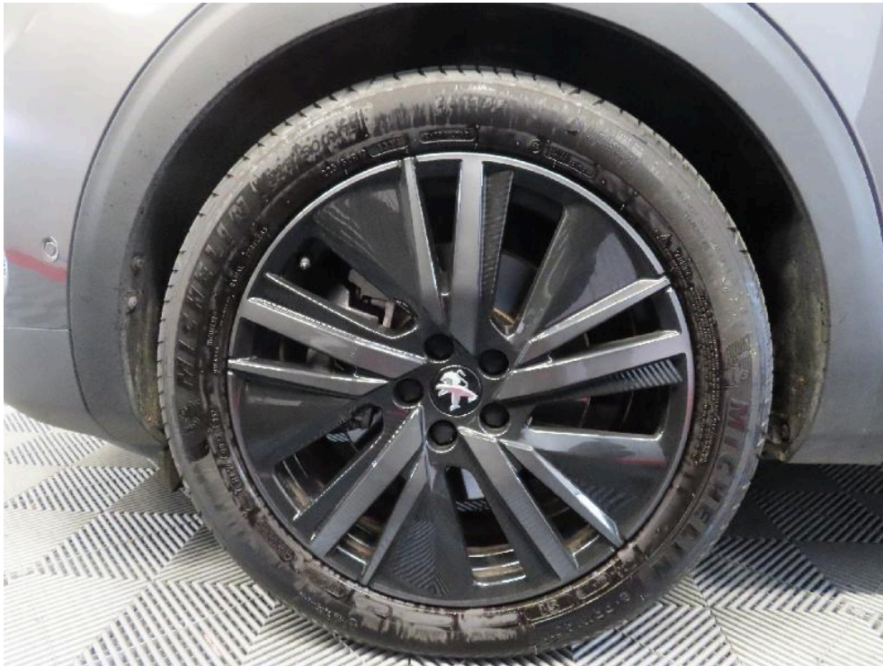
Bild: 11 Reifen / Felge vorn links