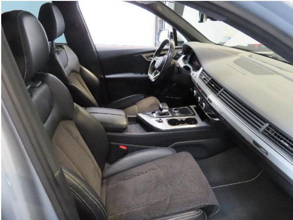
Bild: 7 Innenraum, vorn rechts