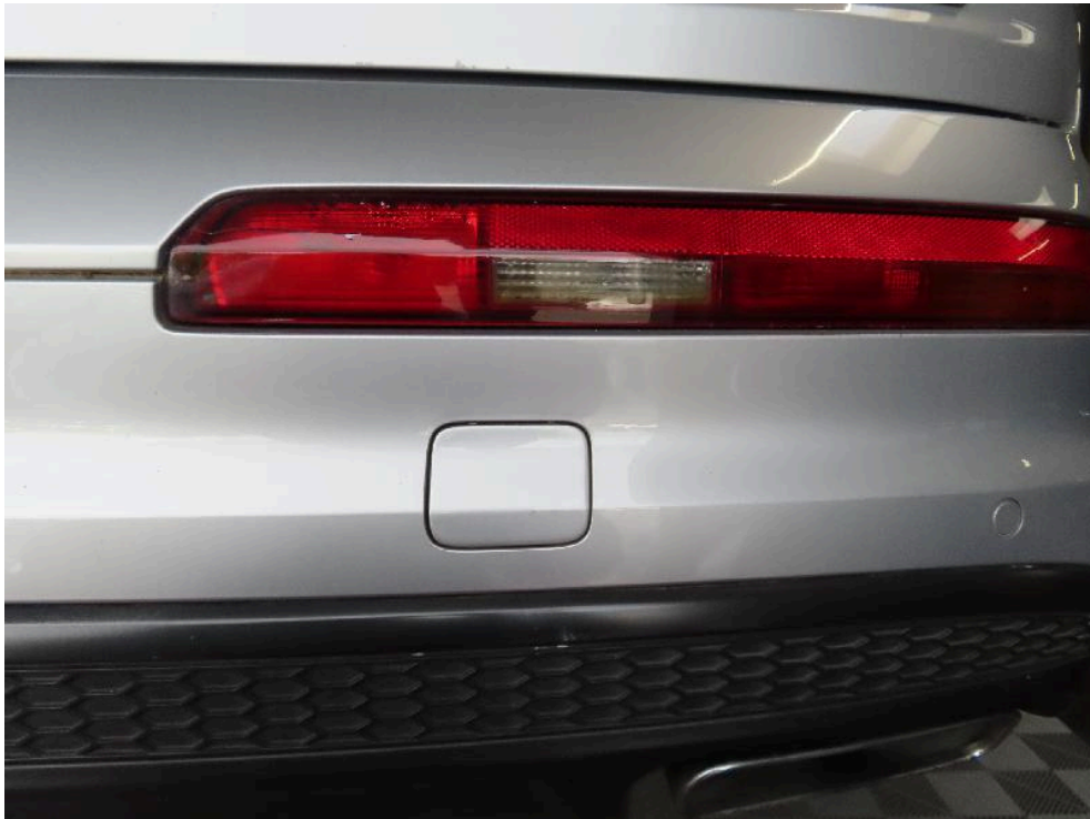
Bild: 17 Rückleuchte hinten unten Beschädigt