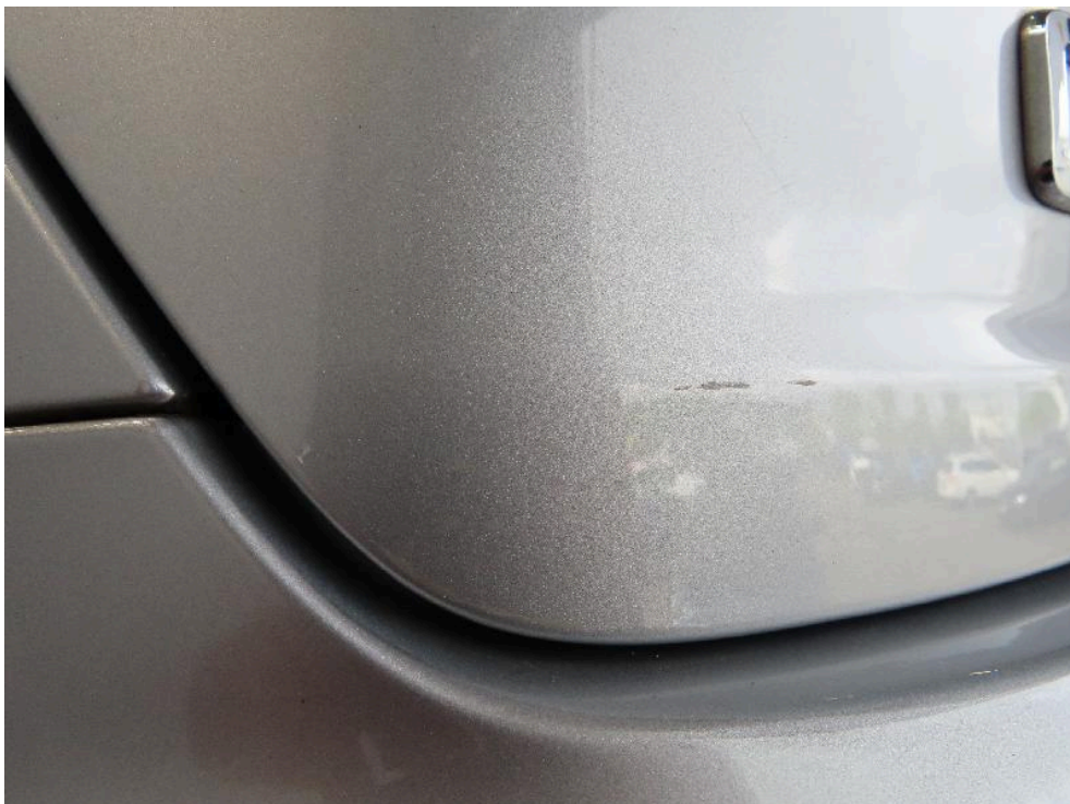
Bild: 18 Kratzer Heckklappe hinten links