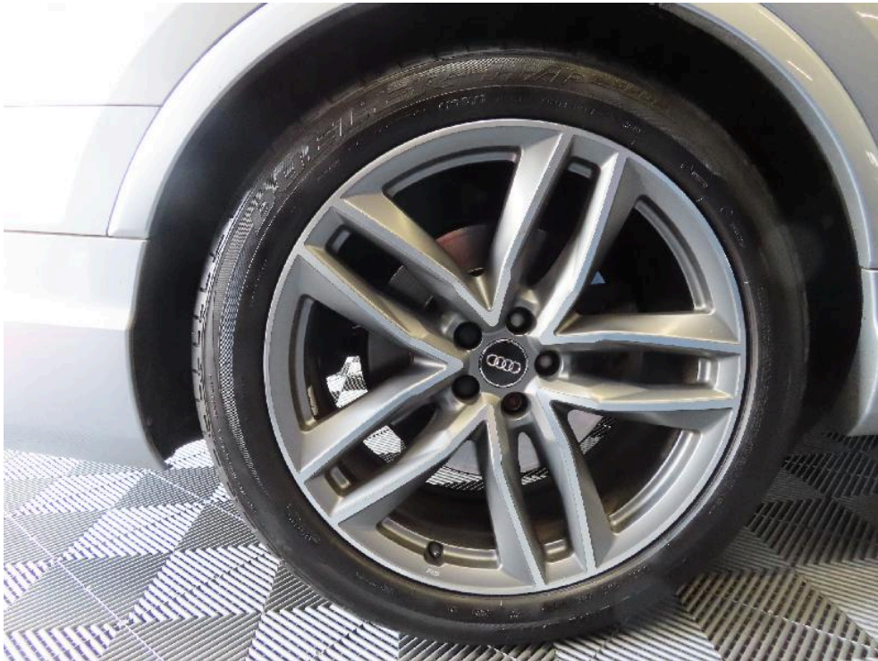
Bild: 13 Reifen / Felge hinten rechts