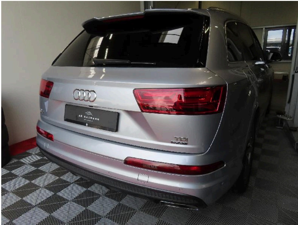
Bild: 3 Gesamtansicht hinten rechts