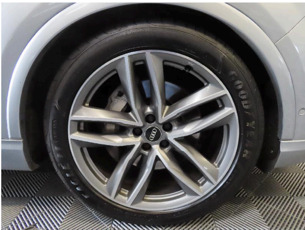
Bild: 12 Reifen / Felge vorn rechts