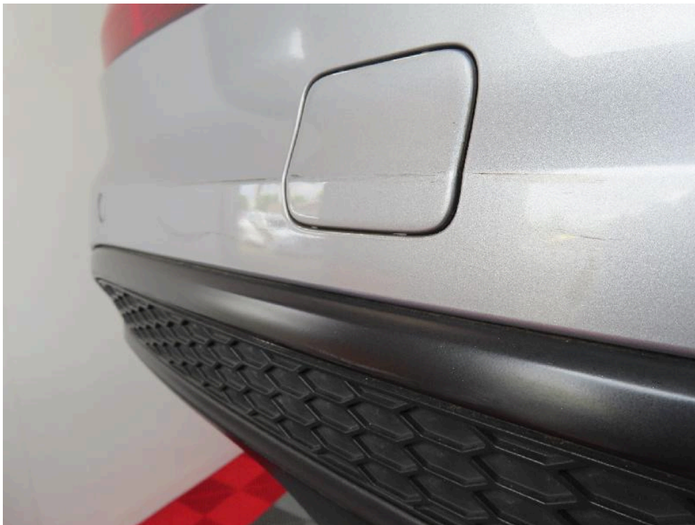
Bild: 15 Kratzer Stoßstange hinten links