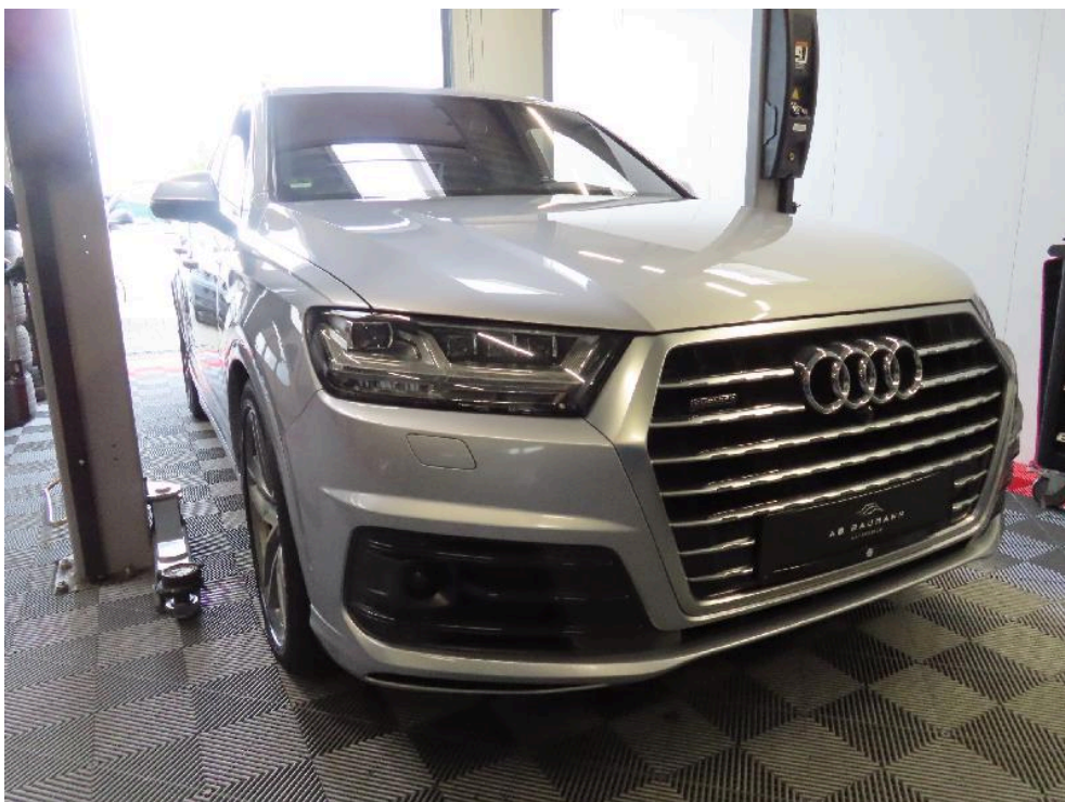
Bild: 2 Gesamtansicht vorn rechts