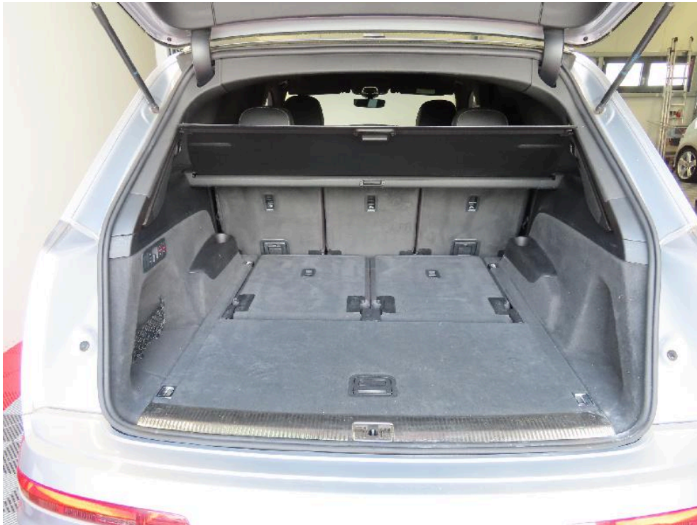
Bild: 9 Kofferraum