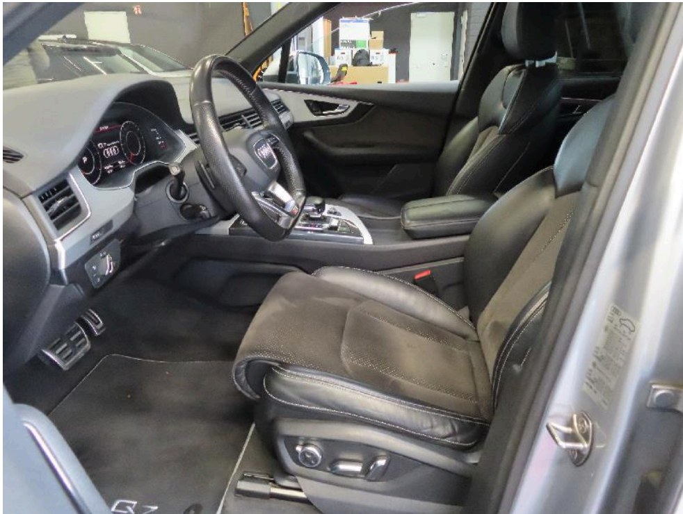
Bild: 5 Innenraum, vorn links