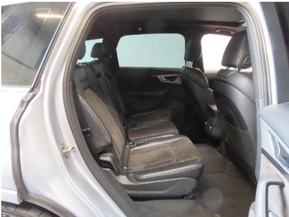
Bild: 8 Innenraum, hinten rechts