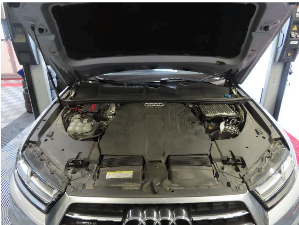
Bild: 6 Motorraum