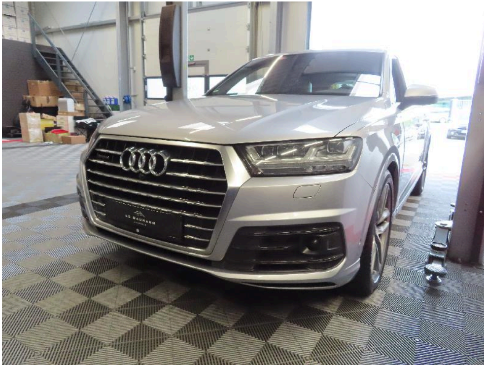
Bild: 1 Gesamtansicht vorn links