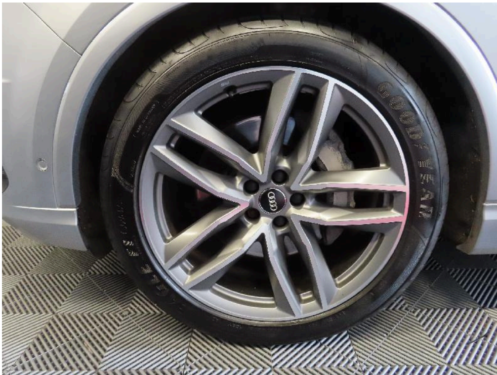
Bild: 11 Reifen / Felge vorn links