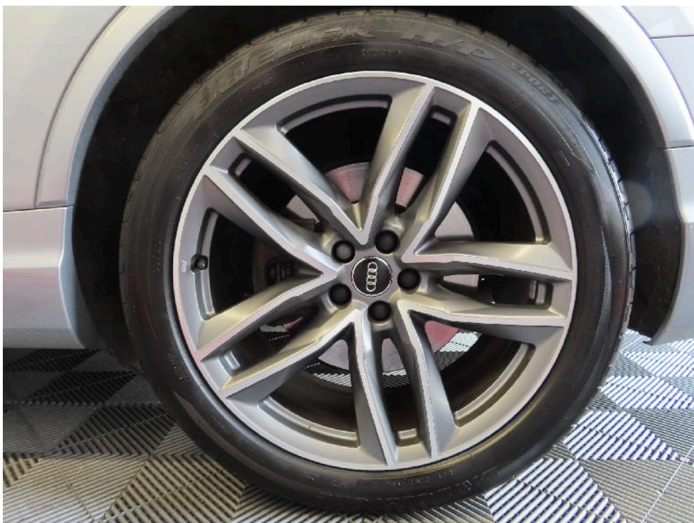
Bild: 14 Reifen / Felge hinten links