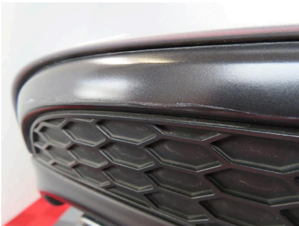
Bild: 16 Kratzer Stoßstange hinten links