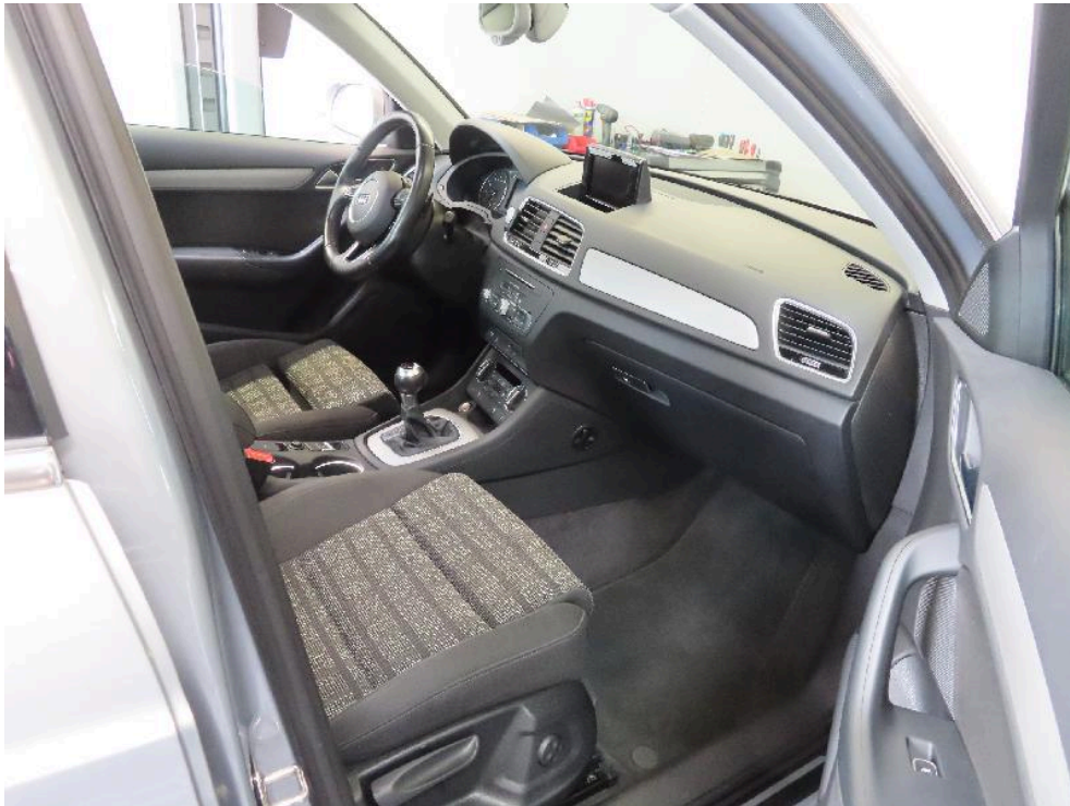
Bild: 7 Innenraum, vorn rechts