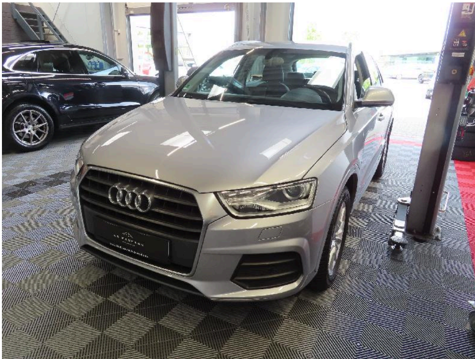
Bild: 1 Gesamtansicht vorn links