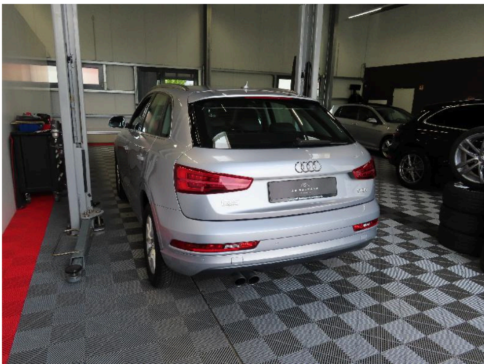
Bild: 4 Gesamtansicht hinten links