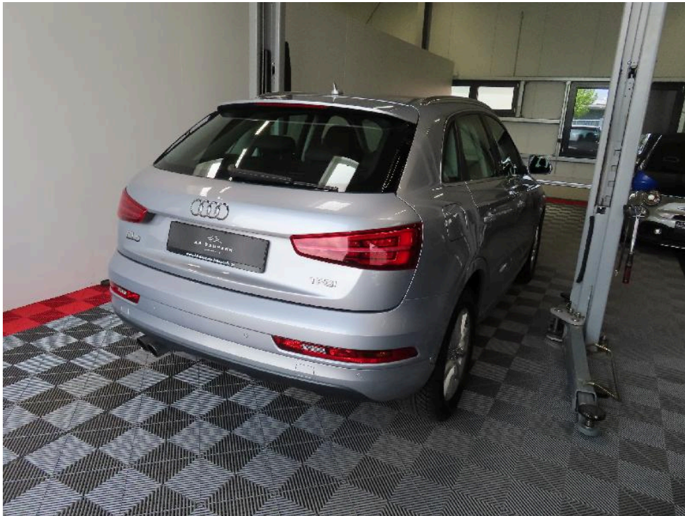
Bild: 3 Gesamtansicht hinten rechts