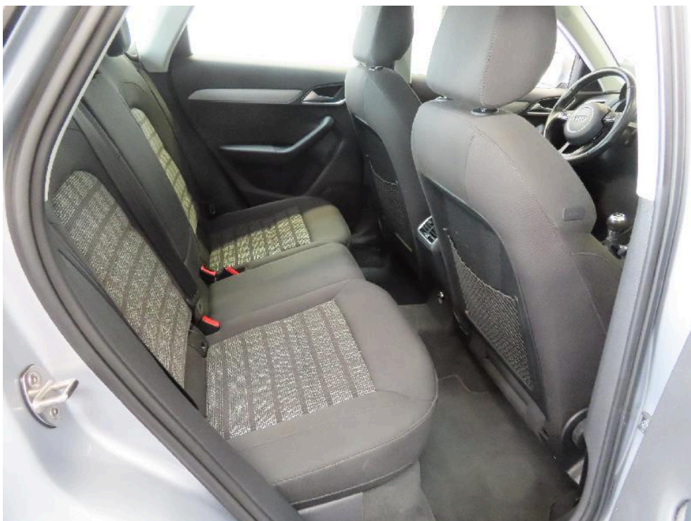
Bild: 8 Innenraum, hinten rechts