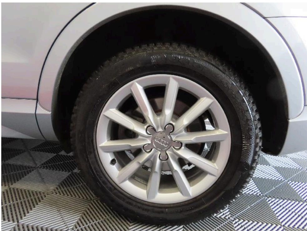
Bild: 14 Reifen / Felge hinten links