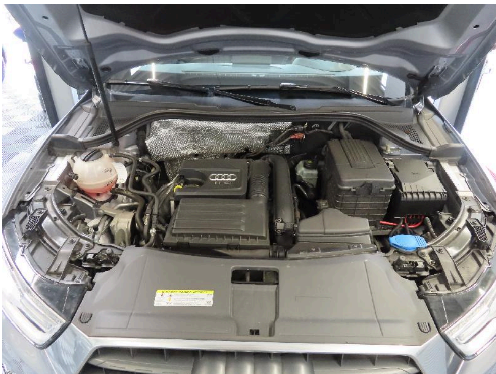
Bild: 6 Motorraum