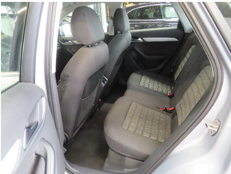
Bild: 10 Innenraum, hinten links