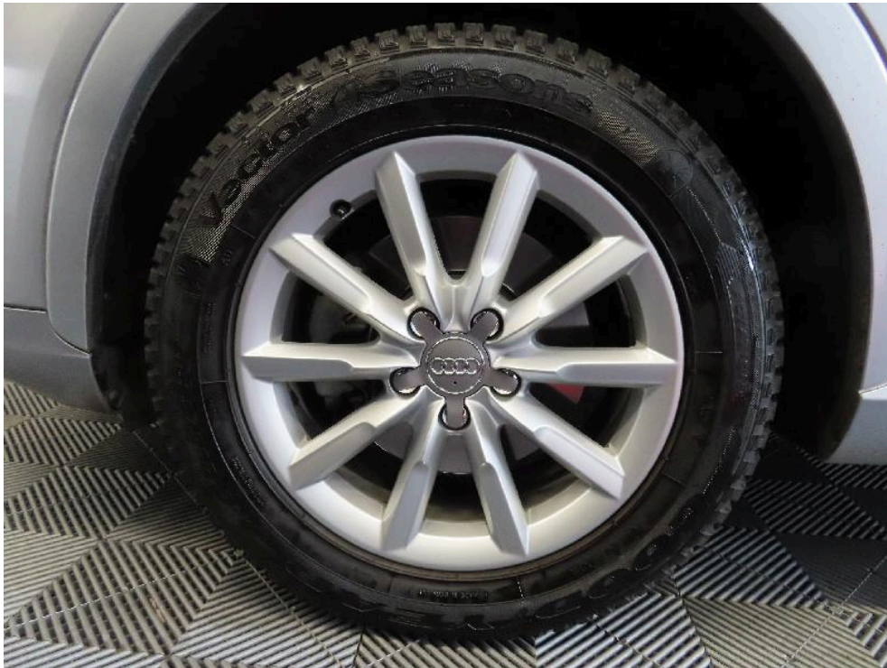
Bild: 11 Reifen / Felge vorn links