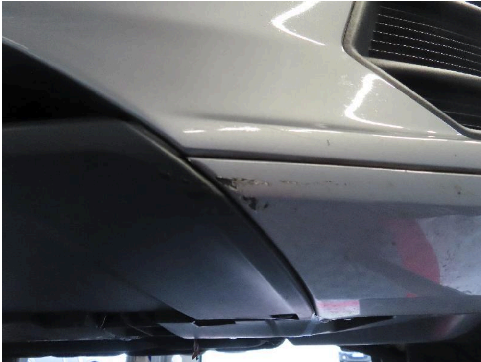
Bild: 15 Kratzer Stoßstange v.l. unterhalb