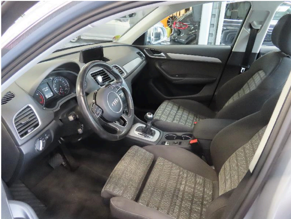
Bild: 5 Innenraum, vorn links