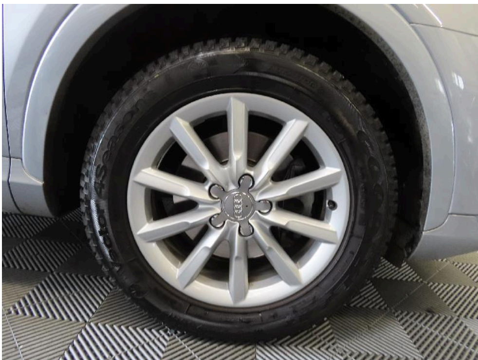
Bild: 12 Reifen / Felge vorn rechts