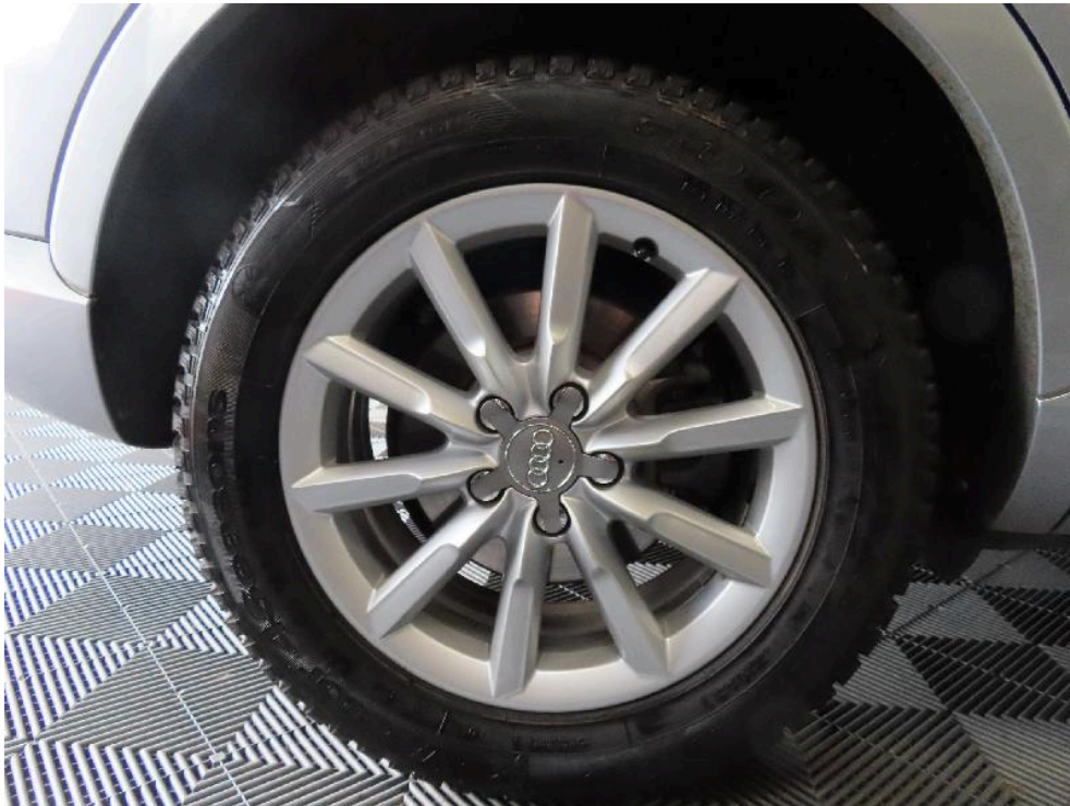
Bild: 13 Reifen / Felge hinten rechts