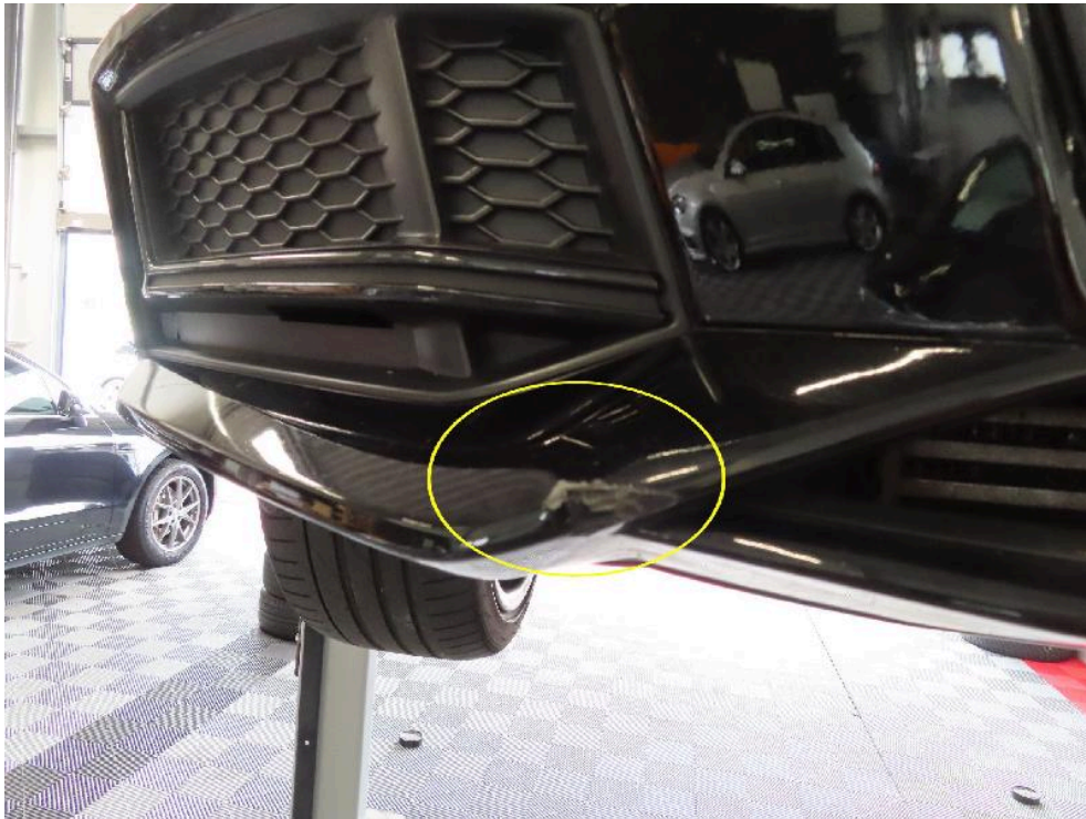
Bild: 15 Schramme Stoßstange vorn rechts