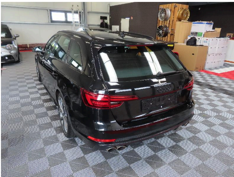
Bild: 4 Gesamtansicht hinten links