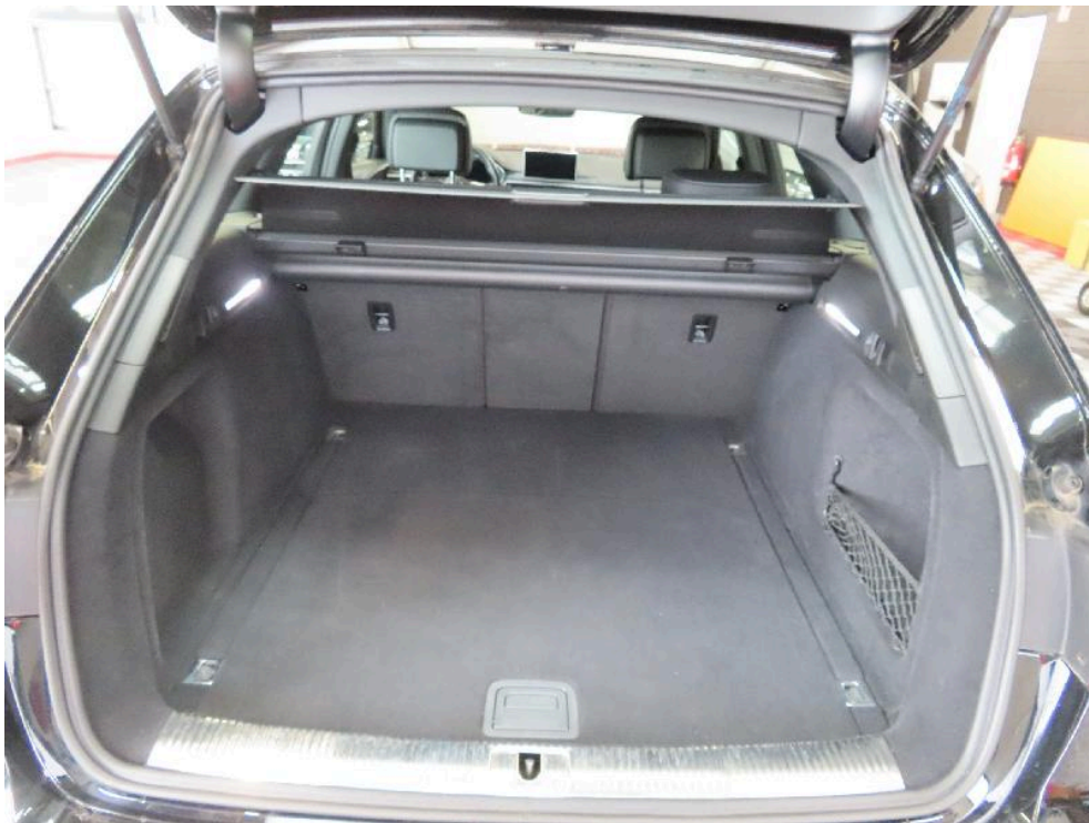
Bild: 9 Kofferraum