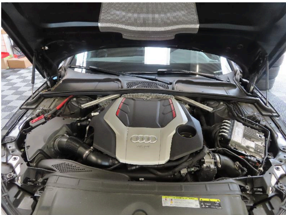
Bild: 6 Motorraum