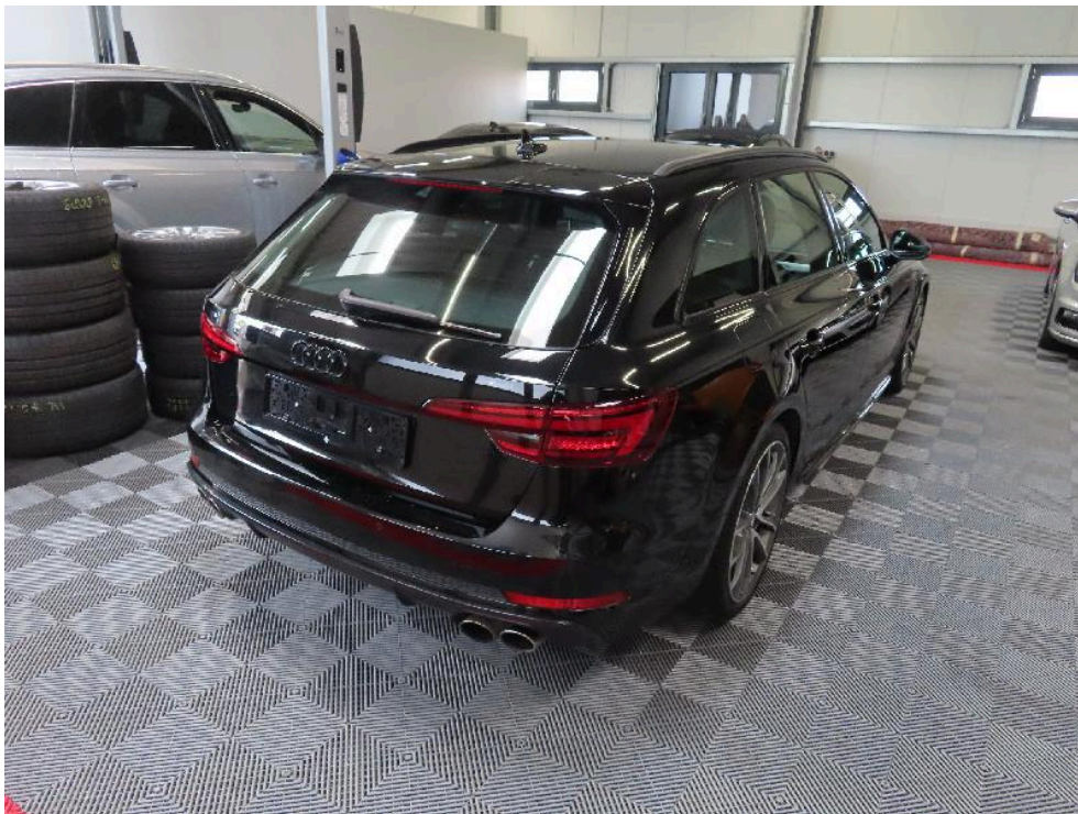
Bild: 3 Gesamtansicht hinten rechts