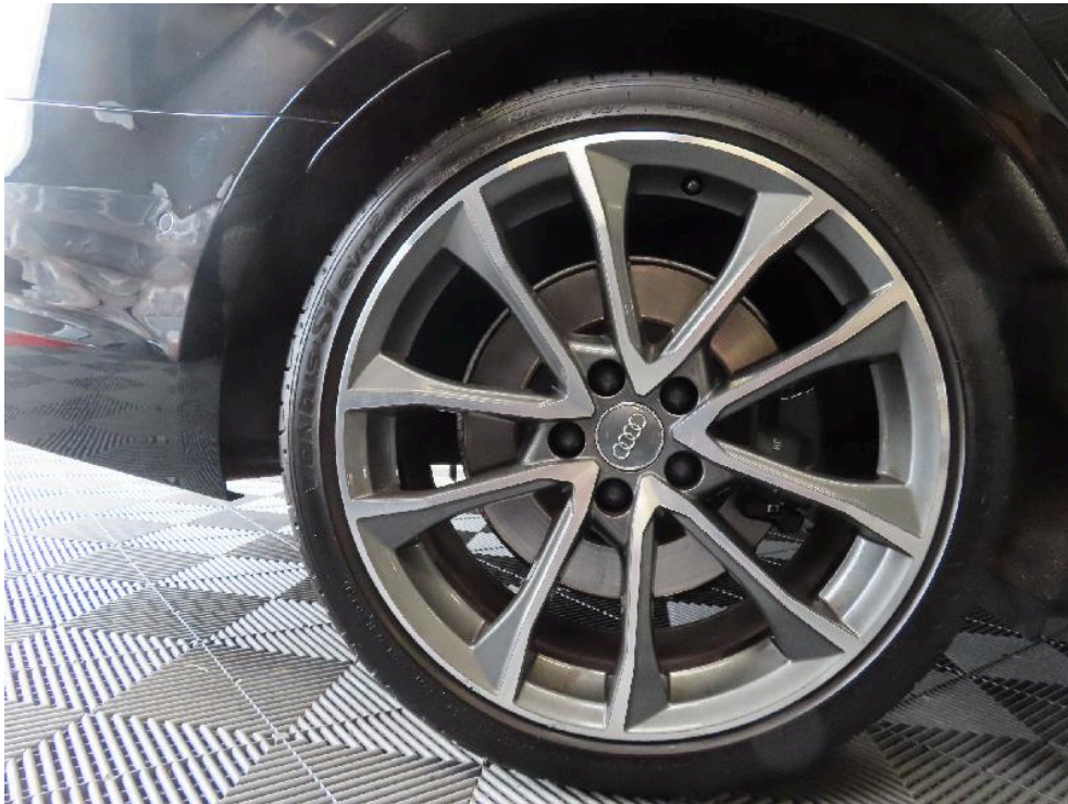
Bild: 13 Reifen / Felge hinten rechts