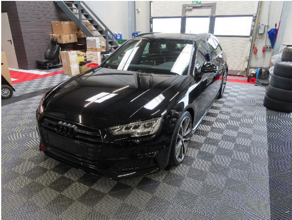
Bild: 1 Gesamtansicht vorn links