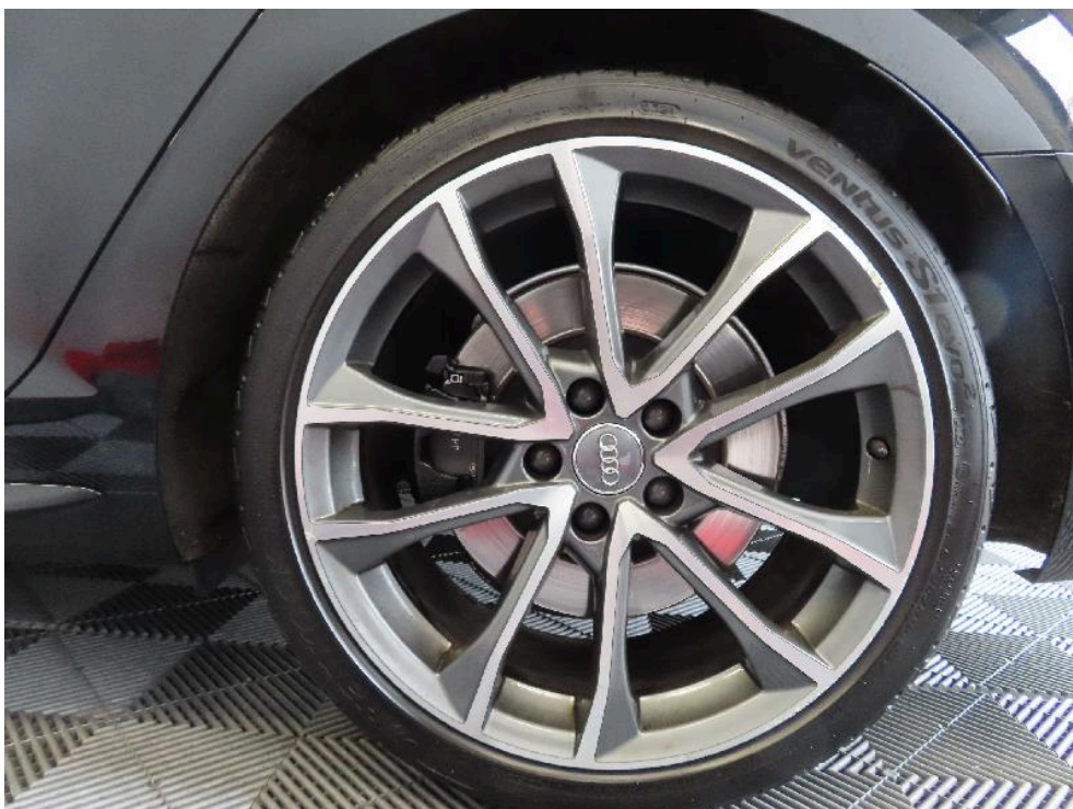
Bild: 14 Reifen / Felge hinten links