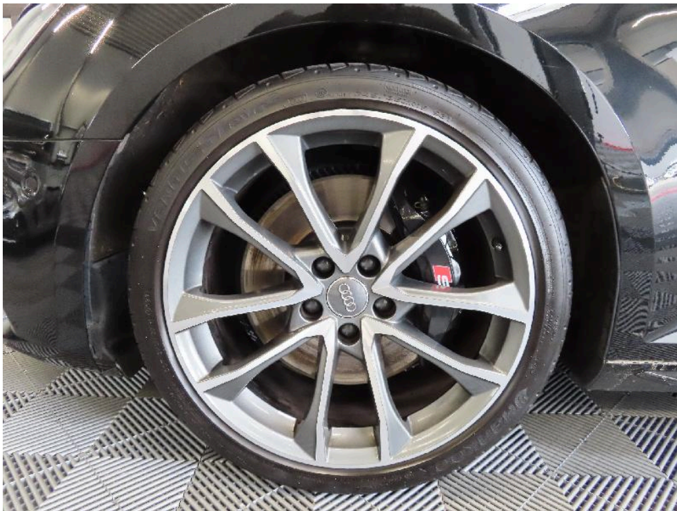
Bild: 11 Reifen / Felge vorn links