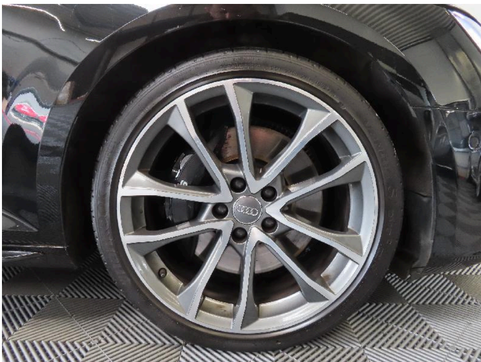
Bild: 12 Reifen / Felge vorn rechts