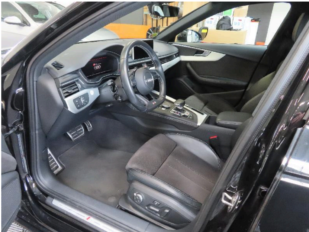
Bild: 5 Innenraum, vorn links