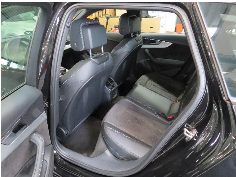
Bild: 10 Innenraum, hinten links