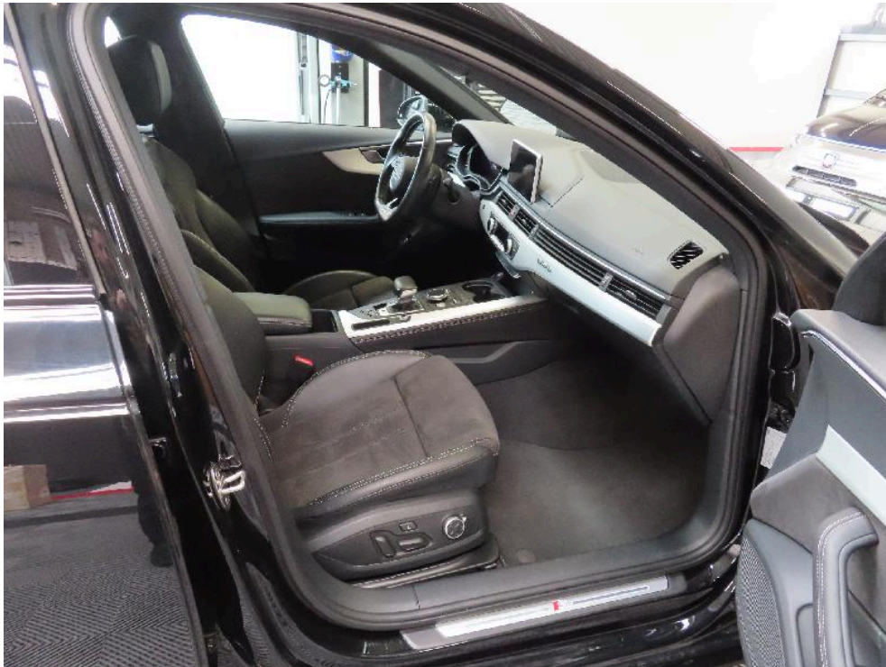
Bild: 7 Innenraum, vorn rechts