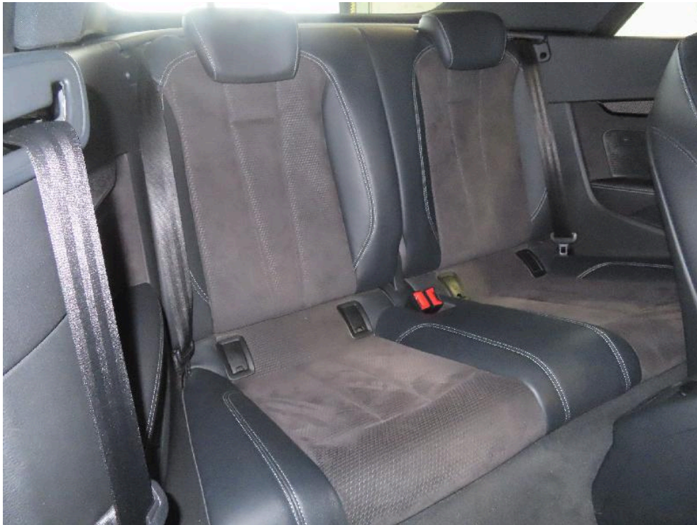
Bild: 9 Innenraum, hinten rechts