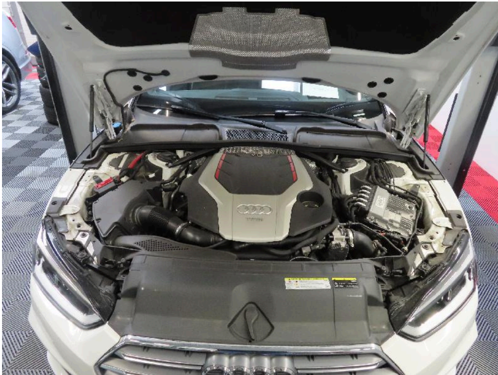
Bild: 7 Motorraum