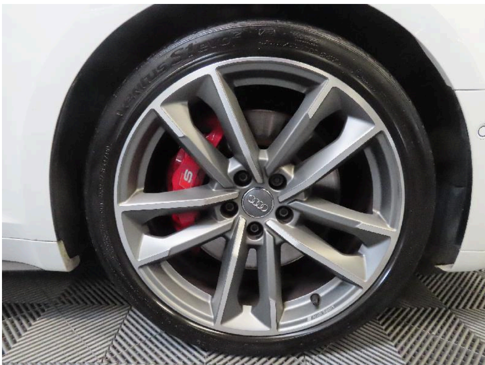
Bild: 12 Reifen / Felge vorn rechts