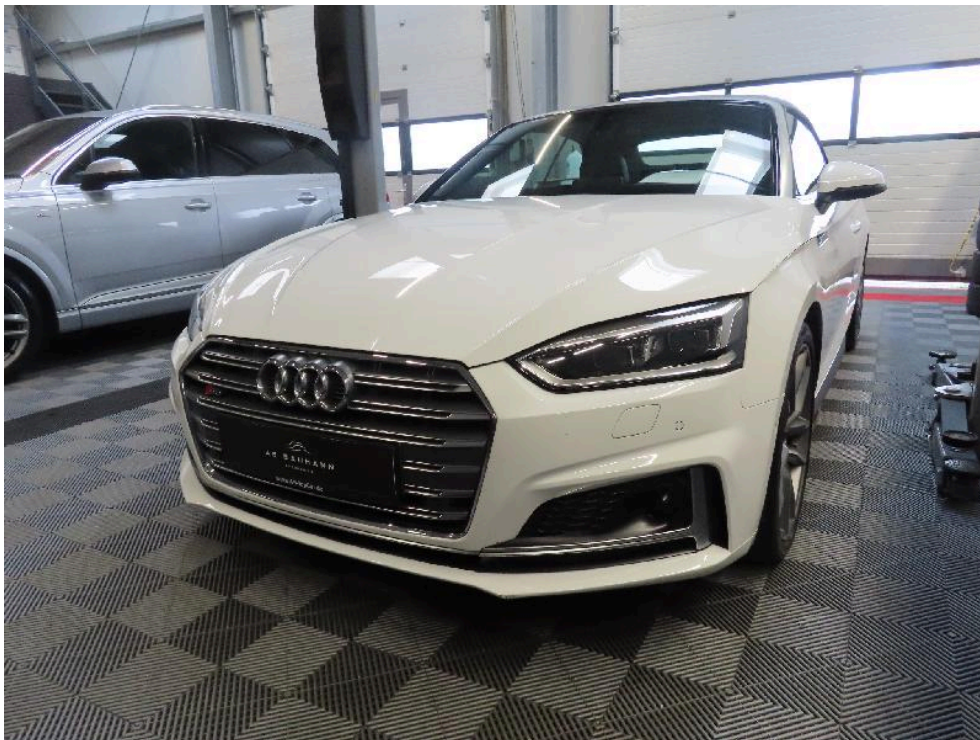
Bild: 1 Gesamtansicht vorn links