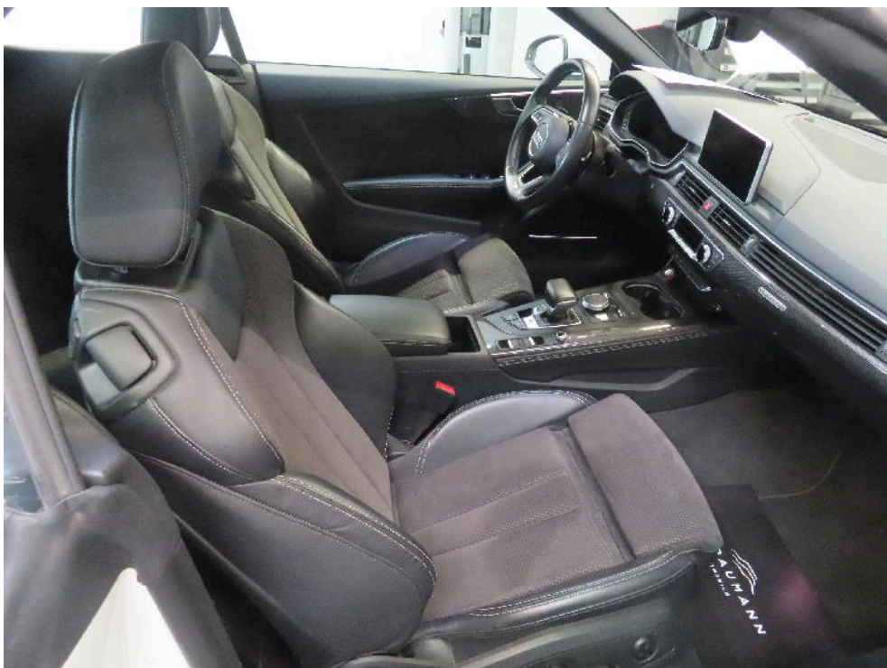
Bild: 8 Innenraum, vorn rechts