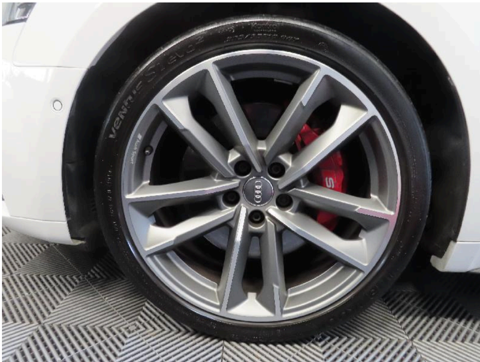
Bild: 11 Reifen / Felge vorn links