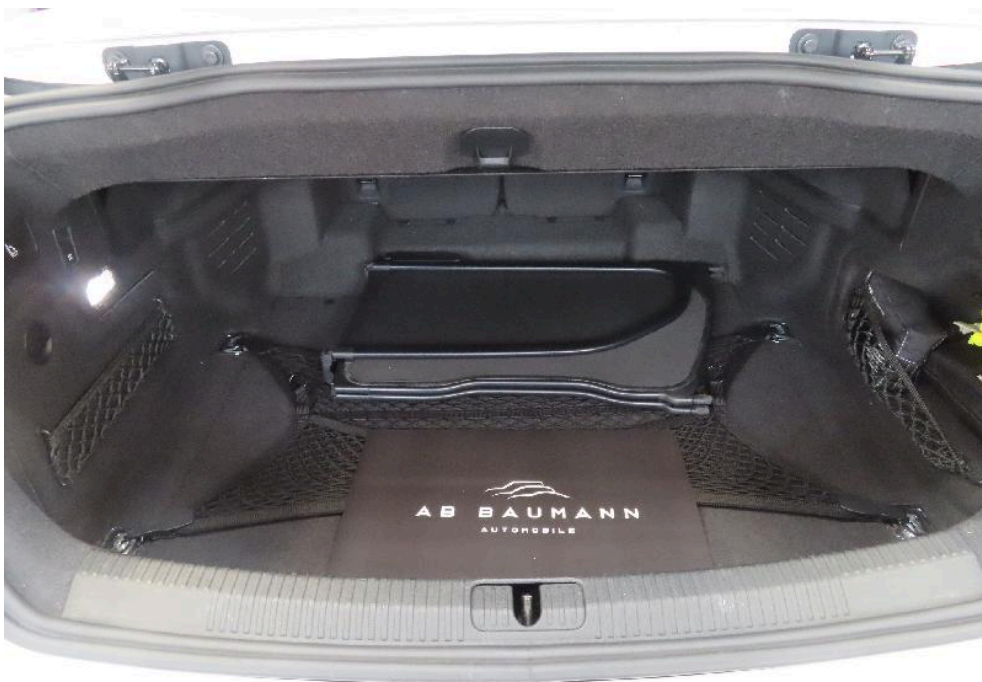
Bild: 10 Kofferraum