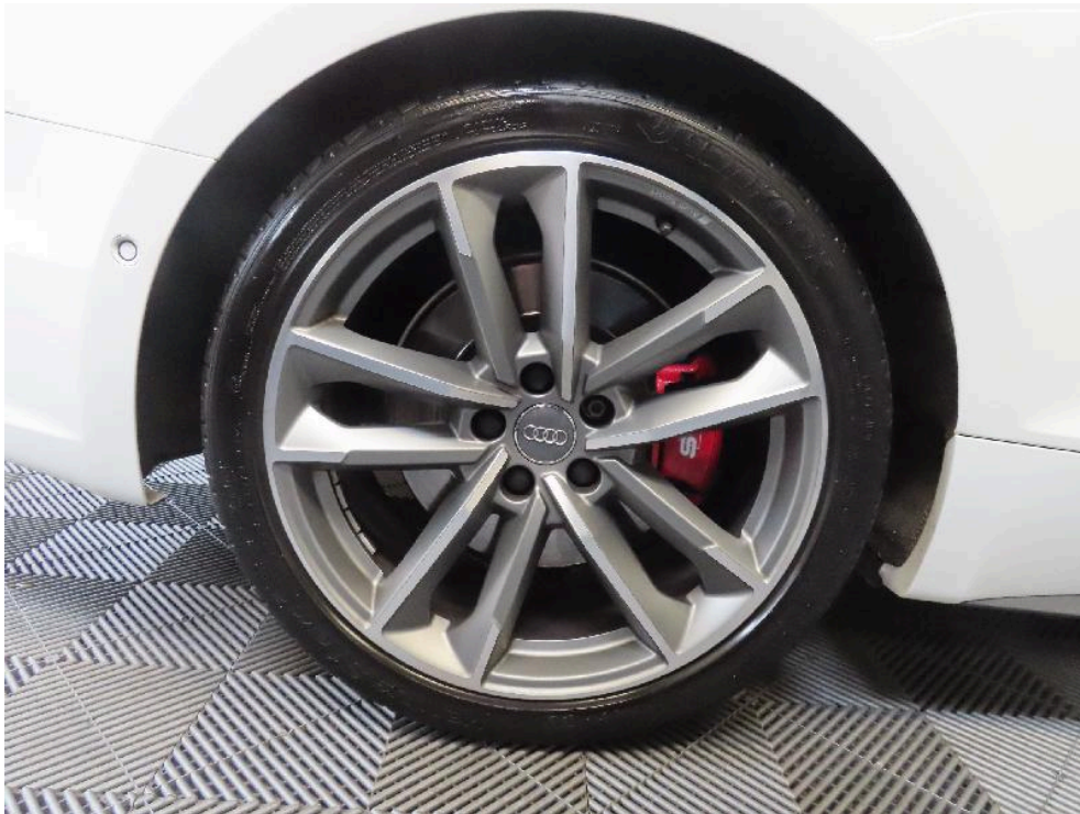
Bild: 13 Reifen / Felge hinten rechts