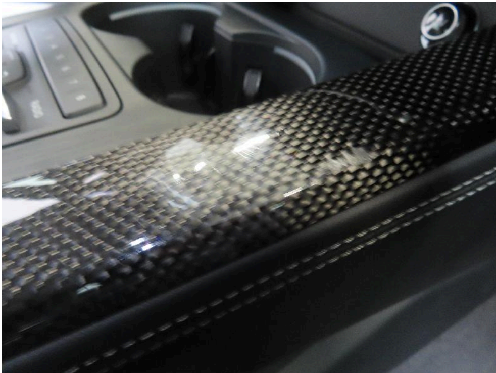
Bild: 15 Kratzer Mittelkonsole