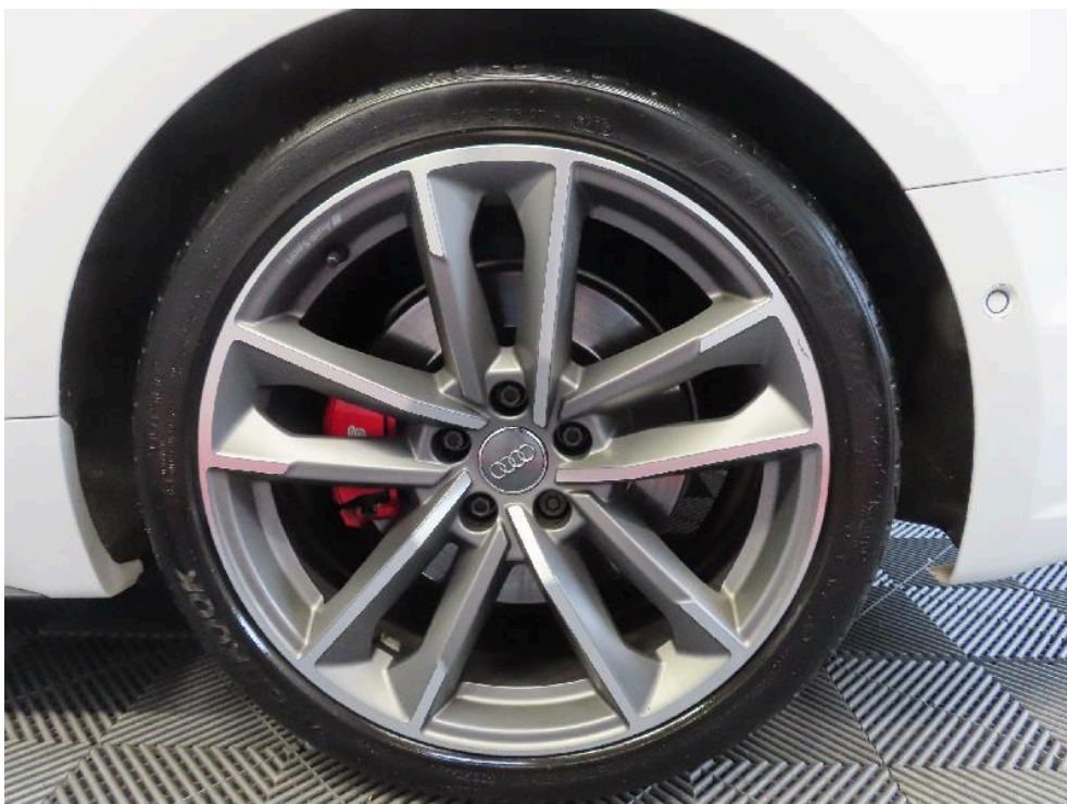
Bild: 14 Reifen / Felge hinten links