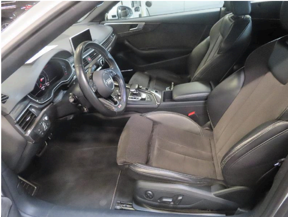
Bild: 5 Innenraum, vorn links