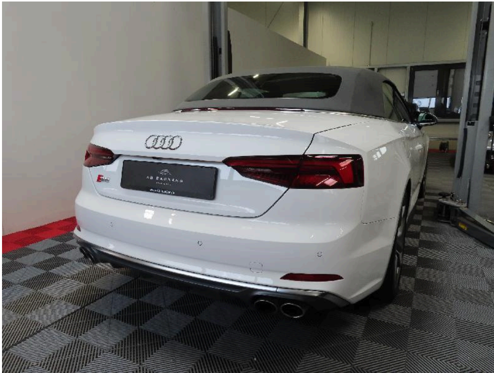
Bild: 3 Gesamtansicht hinten rechts