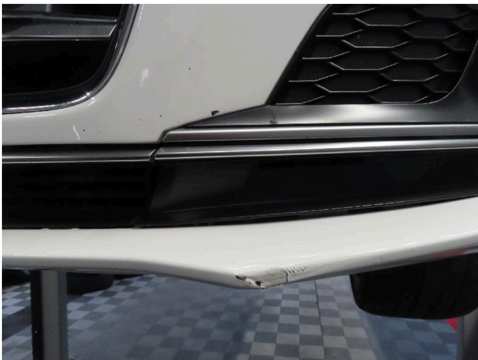
Bild: 16 Kratzer/ Delle Stoßstange vorne links