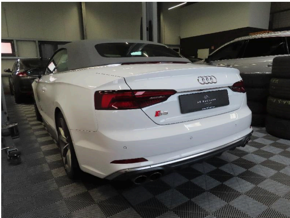
Bild: 4 Gesamtansicht hinten links