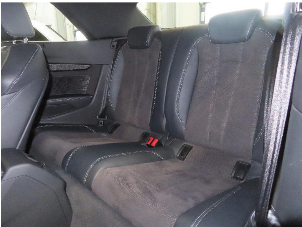
Bild: 6 Innenraum, hinten links